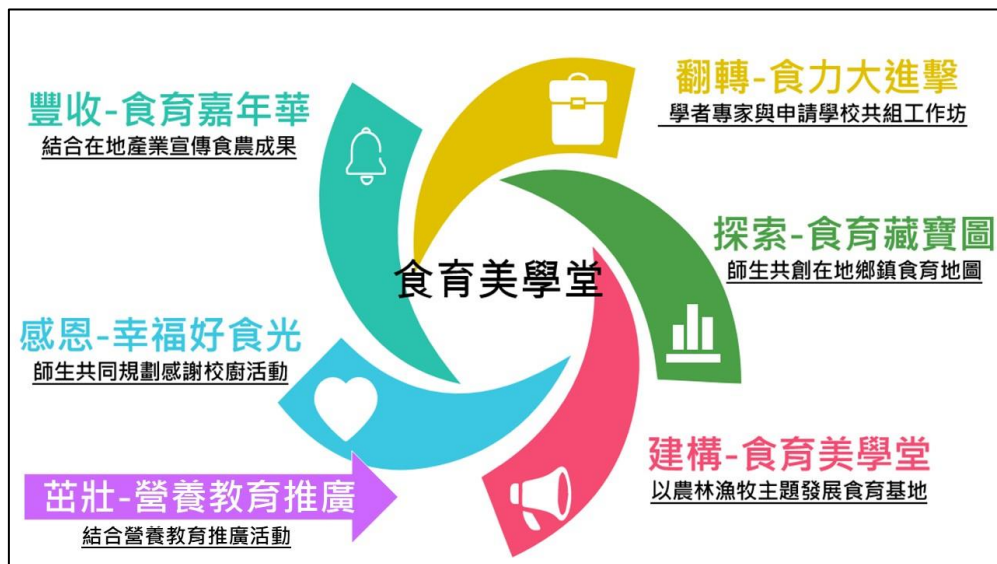
圖 2 本縣食育美學堂概念圖